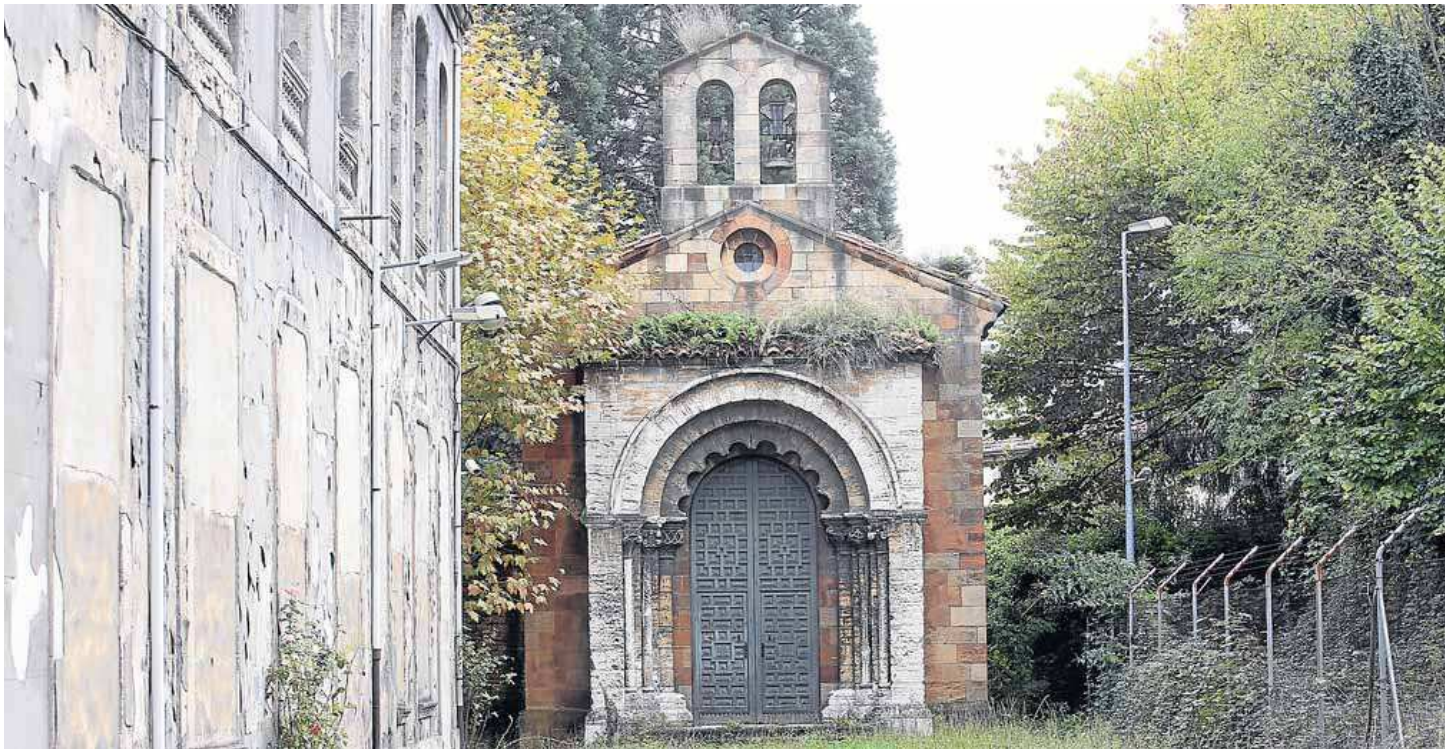
La capilla de La Vega, que el Ministerio de Defensa cede a la ciudad, junto con el claustro. :: ALEX PIÑA